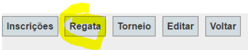
Figura 4. Para fazer uma nova inscrição em uma regata clique no botão Regata.

Na próxima tela o sistema mostrará as inscrições realizadas nas regatas anteriores.